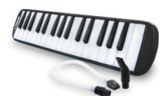
Melódica (32 notas)