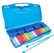
Metalófono (25 notas)